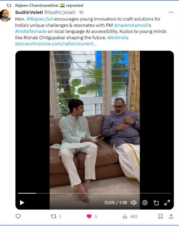
The minister retweeted my interaction with him.

Deccan Chronicle – widely circulated English newspaper.